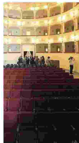
TEATRO Un sopralluogo agli Impavidi che oggi sarà riaperto